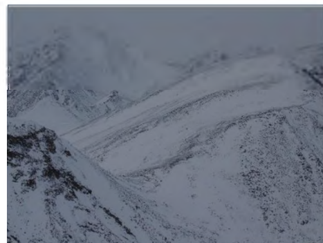
Вид на в. Железногорск