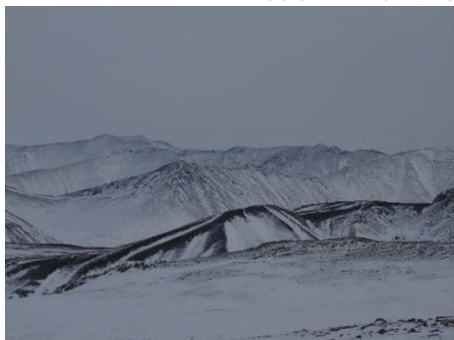
Вид с пер. Панорамный на массив вулкана Чепе

Подъем по курумнику – требует внимания. Ноги могут провалиться и застрять.