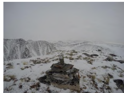
Тур на в. Железногорск 2А, 2456,4

С седловины перевала Аку-Сыни, не снимая кошек, начали подниматься на вершину справа. Подъем осуществляли по гребню. Правая сторона вершины обрывается отвесно практически в озеро. Виды открываются грандиозные. Черные лавовые поля вулкана Чепе, царство таких же черных, зачастую практически лишенных растительности, пиков. Огромная горная страна без конца и края. Совершенно не заселенная людьми, заселенная только лосями, медведями, рассомахами и белыми куропатками. Страна в которой бьют из-под земли горячие источники и разноцветные нарзаны. Страна сотен ледяных водопадов и красивейших каньонов. Подъем следует вести с крайней осторожностью. Попадают кулуары, обрывающиеся крутыми уступами.