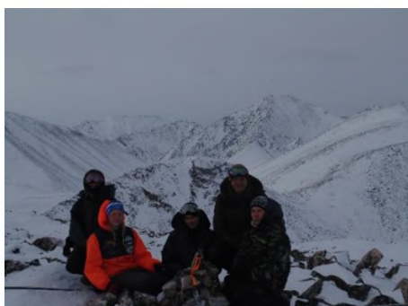
У тура пер. Панорамный 1А, 1972

Для прохождения перевала требуются лыжные палки, кошки.