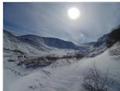
Вид на пер. Панорамный при