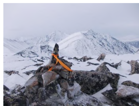
Тур пер.Аку-Сыни 1Б, 1999

Выход в 8-00. Подъем на перевал начинается от озера, идем без лыж и без кошек. Первые 100 метров уклон около 20гр.Затем начинаются курумники и большие глыбы. Ноги то и дело проваливаются в пустоты под снегом. Каждый шаг требует особой осторожности.