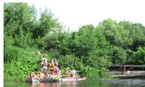
23.06.2016. Обнос. Низкий мост в с. Щербиновка

удовольствие. Через 40 минут встали лагерем ниже с. Приречное (смотрим по навигатору). Стоянка расположена на небольшом песчаном наносном выступающем берегу, справа (пхд.). Мест под палатки хватает и дальше занимаемся лагерем, на сегодня хватит. Прошли примерно 24 км. Воду везли с собой, дров по берегу много.