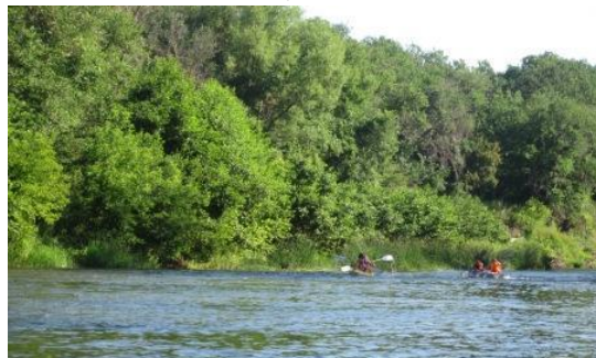
25.06.2016. Район старой плотины у пгт Лысых гор

Встали тяжело, устали немного, вчера прошли много.