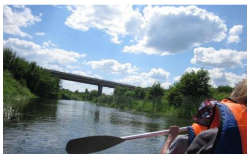
23.06.2016. Автомост в районе г. Аткарск

группа из шести судов начала движение вниз по реке, в сторону Лысых Гор, хотя других вариантов не существует. Разве, что нанять бурлаков, которые протащат нас вверх по течению. Через 700-800 метро в Медведицу справа (пхд.) впадает небольшая река Аткара, место впадения