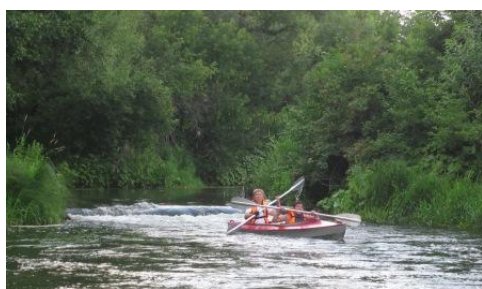
23.06.2016. Слив через трубу в с. Щербиновка

по всей реке, очень слабое, приходится постоянно работать веслами. Через 5 или 6 км началась серия правых-левых поворотов, причем на 180 градусов. Сначала солнце светит в затылок, через десять минут в лицо, а затем снова в спину. Проблем с управлением байдарками в этой части нет, разве, что берега местами сильно завалены поваленными старыми деревьями. Но при небольшой скорости между ними достаточно легко лавировать. Берега в основном поросшие высокой травой и камышом. На всем протяжении вдоль береговой линии растут кувшинки (лилия водяная) и кубышки (желтые цветы). Повороты реки создают сильные порывы ветра (пр. до 5-6 м/с.), из-за чего иногда судно относит к берегу. Некоторые экипажи благодаря ветру в течение дня занимались «прибрежным вождением» и немного отставали, минут на 10-15. Через 3,5 часа были в районе села Щербиновка. Здесь река расширяется до 35 метров, а через 1 км, ближе к с. Приречное, расположен низкий автомобильный мост, приходится суда обносить, справа (ор.). Перед мостом находится (за 100 метров) островок,