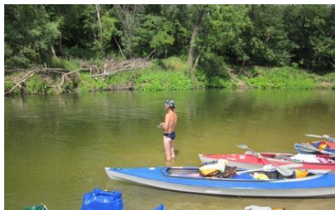
24.06.2016. Рыбалка с. Б.Рельня

Примерно через 10 км снова серия крутых поворотов, мелководье сменяется небольшими