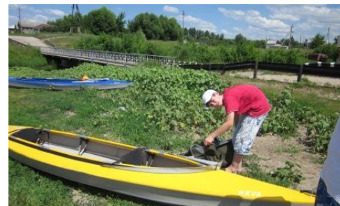
23.06.2016. Место старта, сборка судов

петлю с левым разворотом. Примерно через 40 минут проходим под автомобильным мостом. Опоры стоят широко, примерно 20 метров, так что помех никаких не создают. Мост высокий, около 6-8 метров. Течение в этой части, вообще как и