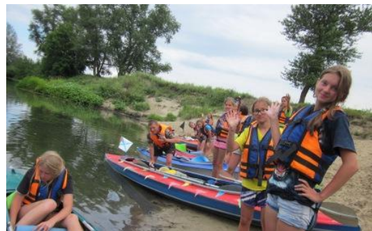
25.06.2016. Старая плотина у пгт Лысых гор

решили сколько набирать в Лысых Горах. Солне уже жарит на всю катушку. Поэтому ребят заставляем одеть майки с длинным рукавом, бриджи и намазать «морду лица» крЭмом, еще головные уборы, типа бандана, другие панамы сдувает ветром. Сегодня третий день похода,