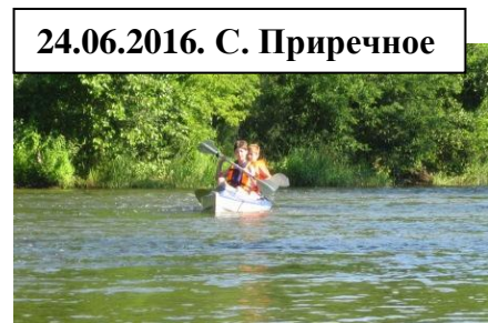
24.06.2016. С. Приречное