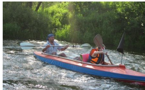
24.06.2016. Перекат «Гранок»

ямами, в которых видна рыба. Еще через 5 км проходим место впадения небольшой реки Идолга (справа пхд.), а через 5 минут автомобильный мост между селами Озерное и Лопуховка. Мост прошли спокойно, ширина между опорами около 4 метров, высота 1,5 метра, за мостом между поросшими камышом берегами