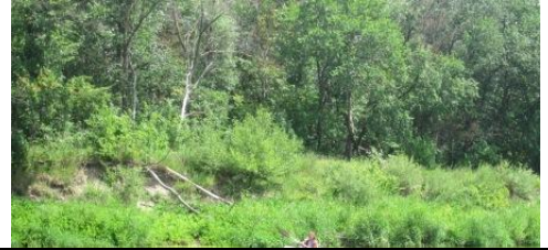
25.06.2016. Повороты с. Николаевка

отправились дальше. Через 3 км, в районе п.г.т. Лысье Г., на правом берегу (ор.), перед ж/д мостом встали на обед, с тем, чтобы купить воды и продуктов (типа мороженого). Идти за продуктами надо к центральной площади (там «Магнит» и «Гроздь»), как идти, лучше спросить у местных, но не далеко, минут 15. Суп на обед, мороженное и сок, через 1,5 часа мы уже снова были в байдарках. Через 300 метров проходим под ж/д мостом, а еще через 200 м под автомобильным. Оба моста высокие и трудностей при их прохождении не возникло. Через 1 км еще один автост, но высотой всего 1,2 м (пришлось нагибаться, расстояние между опорами 6 метров) и здесь приходится немного работать веслами, за мостом быстринка с камышами, длиной метров 100. Через 20 минут проходим село Бутырки. Очередная порция поворотов, проходим села Нагорный, Старая Красавка и к 18.40, на отличном пляже, расположенном на левом берегу (ор.), перед селом Николаевка «сушим вёсла». Правда, места мало из-за того, что выходные и много отдыхающих и сплавляющихся, Медведица пользуется большим спросом. Сходили за молоком в Николаевку.