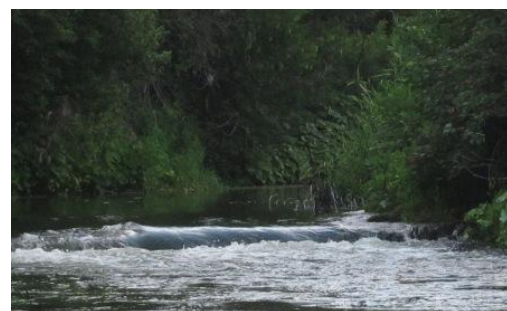
23.06.2016. Слив через трубу в с. Щербиновка