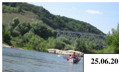
25.06.2016. Ж/д и автостанция у пгт Лысых гор

плотине, вернее ее остаткам. Плотины видно за 300 метров, перед плотиной надо прижаться к левому (ор.) берегу, есть куда. Но с этой стороны обнести далеко, метров 500-600. Мы решили обнести суда справа (пхд.) стороны, правда не совсем удобно, но гораздо ближе, всего 50 метров. Берег заросший и к тому же пришлось спускать суда и вещи с бетонной стены высотой 2 метра с уклоном, примерно, 30 градусов. Обнос занял почти 40 минут. В 12.15 обнос был полностью закончен. За плотиной отдохнули. В 13.20