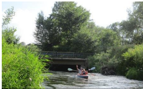
24.06.2016. Автомост с. Озерное

первым. Одако дежурные искупили свою вину великолепным завтраком (что-то вроде овсянки на молоке и бутерами с сыром). До обеда на этом участке нет ни порожков, ни других преград, за исключением быстринок и крутых поворотов реки, о чем писалось в описании первого дня. Далее описание реки будет менее разнообразным, поскольку на всем протяжении