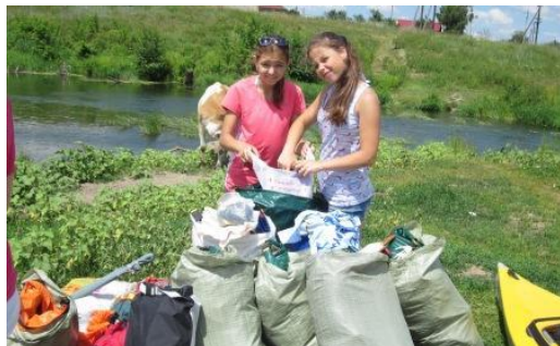
23.06.2016. Место старта г. Аткарск

В 8.30 собрались в лицее и начали погрузку снаряжения.